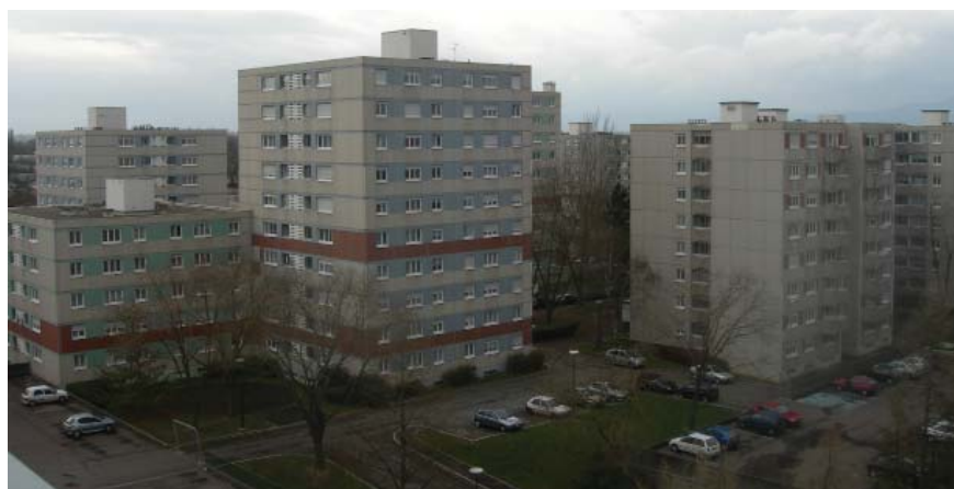
Brustlein est le QPPV affichant le taux de ménages locataires le plus faible de tous les QPPV de m2A (cf tableau du haut).