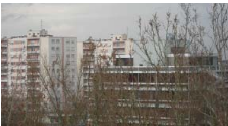
Au sein du QPPV Brustlein, 1/3 des allocataires de la CAF perçoivent le RSA socle.