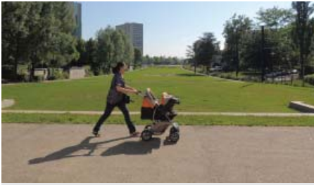
Le QPPV des Coteaux est le plus jeune : 28% de la population y a moins de 14 ans.