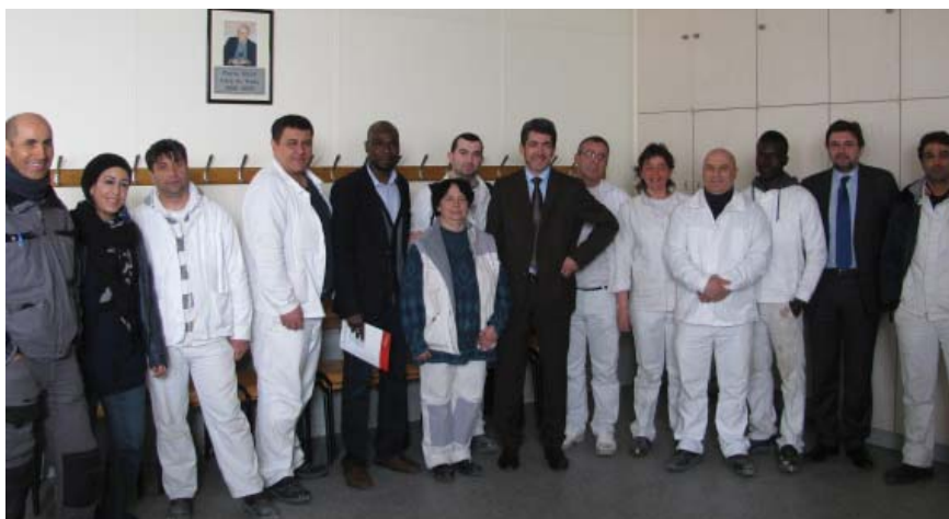
L'insertion (ici la visite d'un chantier à Bourzwiller par le Maire de Mulhouse) peut être un bon moyen de se qualifier et de retrouver un emploi pour les demandeurs d'emploi des quartiers prioritaires.

Les niveaux de diplôme de la population (de plus de 15 ans non scolarisée) sont faibles dans tous les QPPV