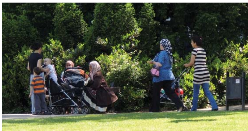
Les QPPV (ici les Coteaux) accueillent une part importante de mères de familles monoparentales