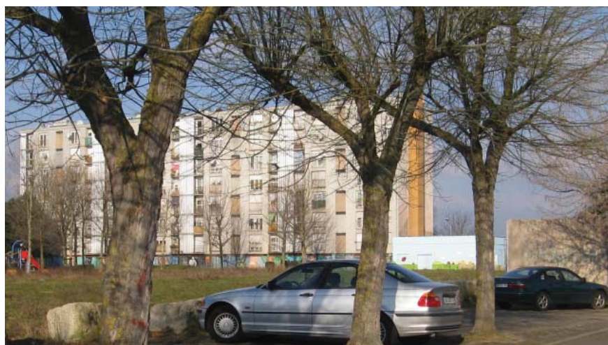
Le QPPV Markstein-la Forêt, à Wittenheim, affiche l'un des taux d'emploi les plus élevés des QPPV de l'agglomération mulhousienne.