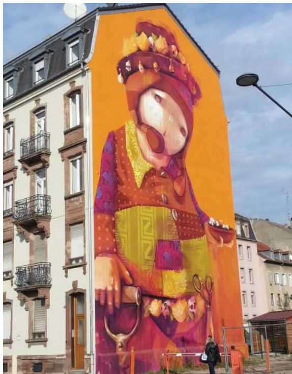
Au coeur du QPPV Péricentre, « El Sembrador », une fresque réalisée en 2014 par l'artiste chilien INTI dans le cadre du projet M.U.R. Portée par l'association mulhousienne Épistrophe et clin d'oeil à la tradition locale des murs peints, cette démarche a pour but de « démocratiser l'art ».