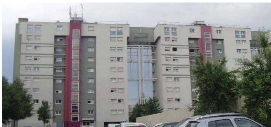
Le Péricentre (ici le secteur Doves et Berges), à Mulhouse, affiche le taux le plus élevé d'allocataires de la CAF dont le revenu dépend entièrement des prestations sociales.

Bénéficiaires des prestations sociales : le rôle d'amortisseur social joué par la CAF se confirme