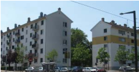
Bourzwiller affiche le taux d'emploi le plus faible (39%), et le taux de bas diplôme le plus élevé (86%) des QPPV de m2A.