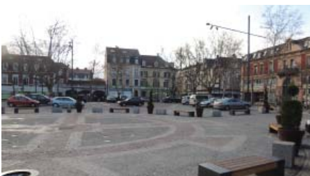
Le QPPV Péricentre est le plus concerné par la mobilité résidentielle : 59% des ménages y habitent depuis moins de 5 ans.