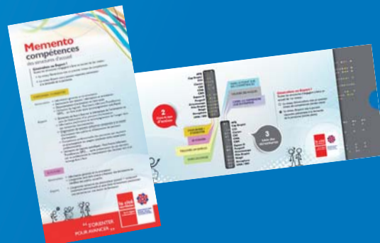
«Compétences des structures d'accueil» Réglette cartonnée interactive (aujourd'hui portée en applicazerzer)