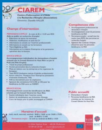
Fiches structures réservées aux professionnels