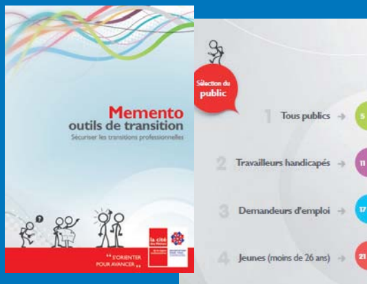
Memento «outils de transition»