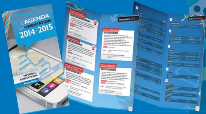
Agenda de l'orientation : Recensement des animations métiers et emplois. (Aujourd'hui porté en application web)