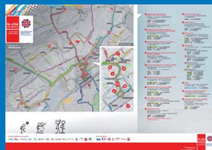
Cartographie de l'ensemble des points de rendez-vous

Travail autour du document « fil rouge » qui a constitué ensuite l'outil « Mémento Compétences des structures d'accueil ».