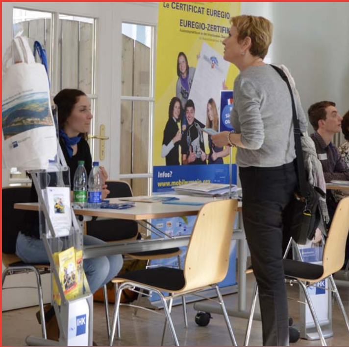
LES FORMATIONS TRANSFRONTALIÈRES