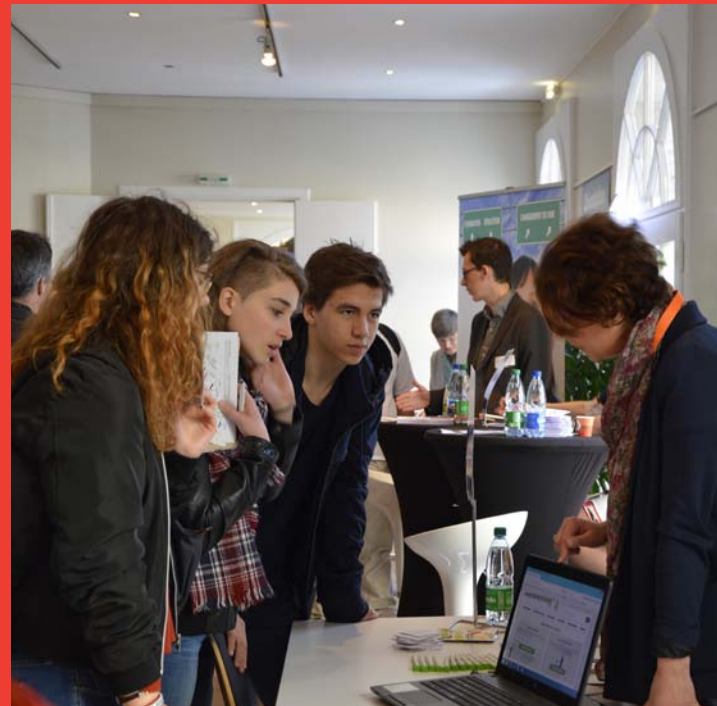
LA RECONVERSION PROFESSIONNELLE / DIE UMSCHULUNG