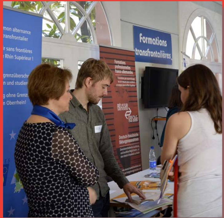
50 INFORMATIONS DONNÉES / INFORMATIONEN