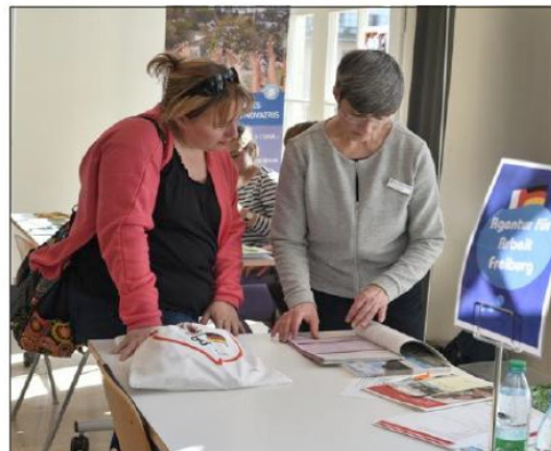
Le salon Warum nicht était organisé hier à l'Orientoscope de Mulhouse par la Maison de l'emploi et de la formation et l'Agentur für Arbeit de Fribourg.

Évidemment, pour les personnes qui parlent allemand, la tentation