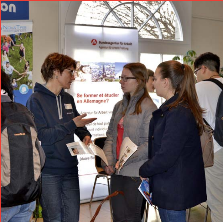
L'ORIENTATION POST-BAC / DIE ORIENTIERUNG NACH DEM ABITUR